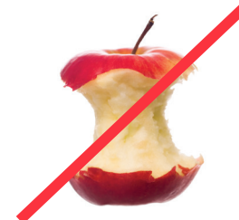
FOOD WASTE RESIDUOS DE ALIMENTOS