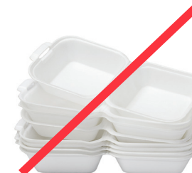
STYROFOAM ESPUMA DE POLIESTIRENO