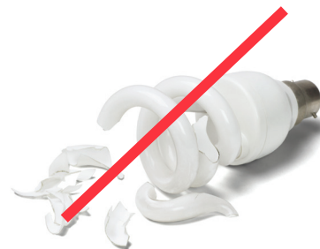
LIGHT BULBS BOMBILLAS