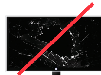
ELECTRONICS PRODUCTOS ELECTRÓNICOS