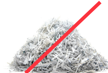
SHREDDED PAPER PAPEL TRITURADO