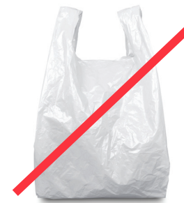
PLASTIC BAGS BOLSAS DE PLÁSTICO