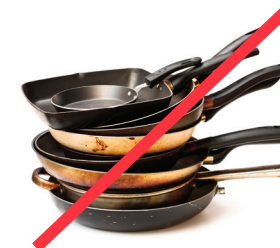
POTS, PANS, SCRAP METAL OLLAS, SARTENES, DESECHOS DE METAL