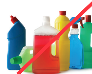
HAZARDOUS MATERIALS MATERIALES PELIGROSOS