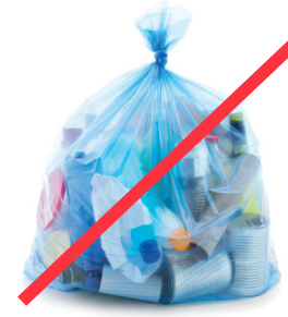
BAGGED MATERIALS MATERIALES EMBOLSADOS